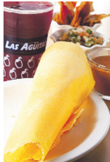
Chicharrón de queso.