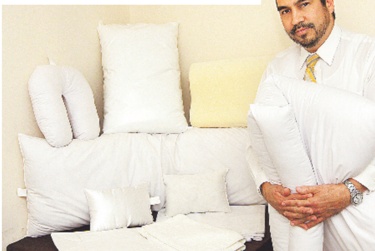
Se ofrecen almohadas especiales y se hacen diseños al gusto del cliente.