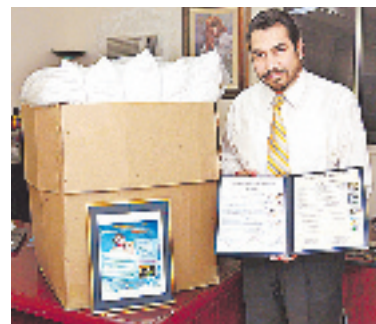
Las almohadas WCM se venden en cajas con mínimo de 6 almohadas de cualquier tipo.