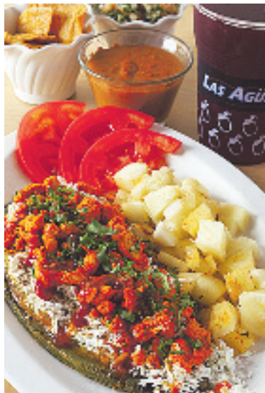
Nopalazo con pollo al pastor.