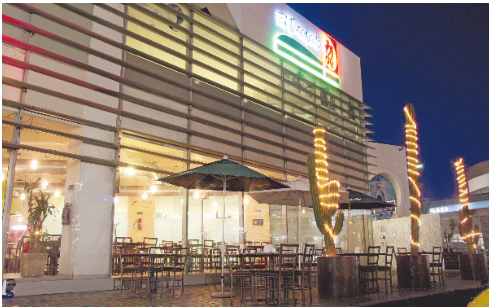
El Tizoncito cuenta con una cómoda terraza para hacer más placentera su visita.