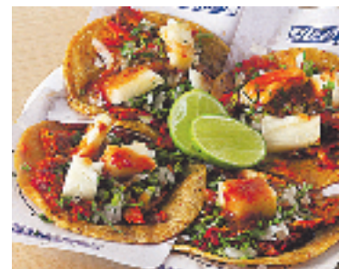
Tacos al pastor con la receta original.